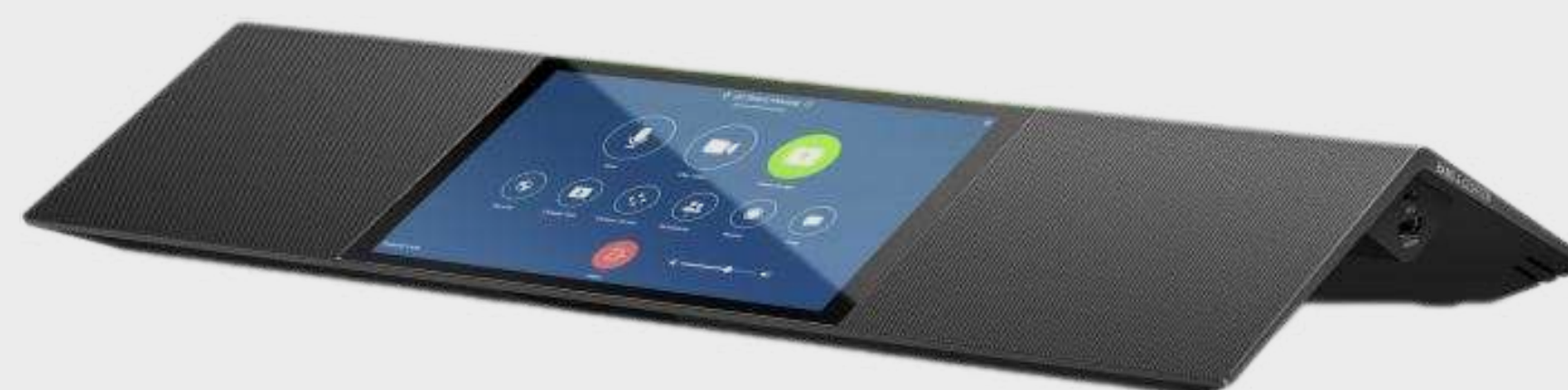
Панели управления от 40 000 р.