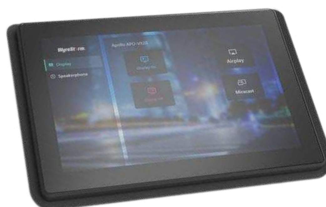
Сенсорные панели- контроллеры Цена по запросу

Подберем оборудование точно под задачу по этим характеристикам: