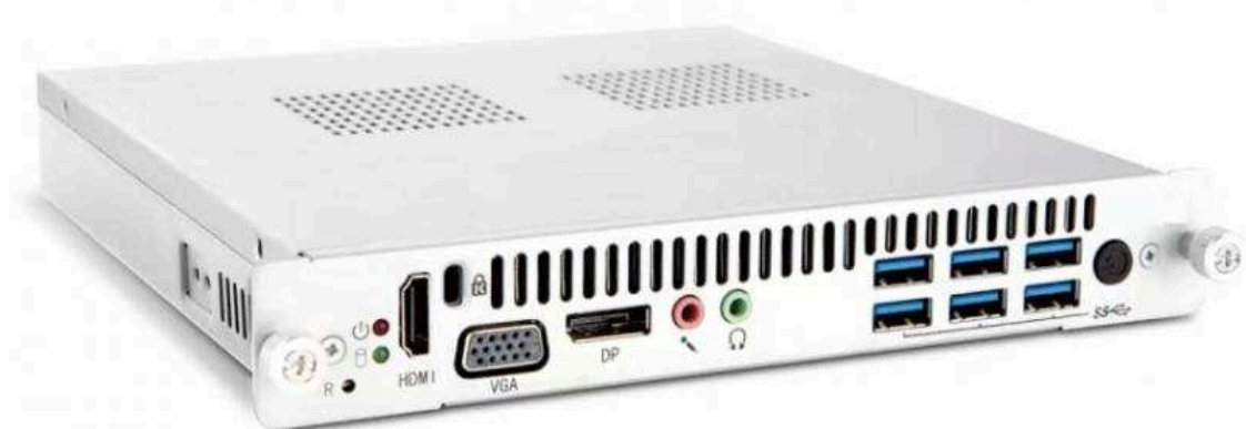
Встраиваемые компьютеры Цена по запросу