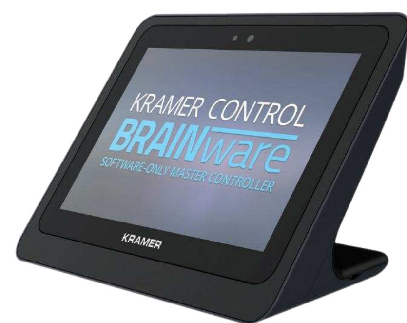
Портативные сенсорные панели от 330 000 р.