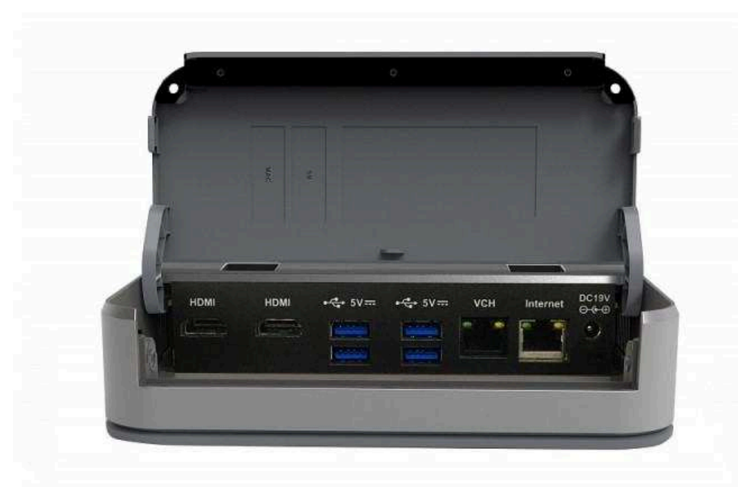
Мини-ПК для конференц-комнат от 168 000 р.