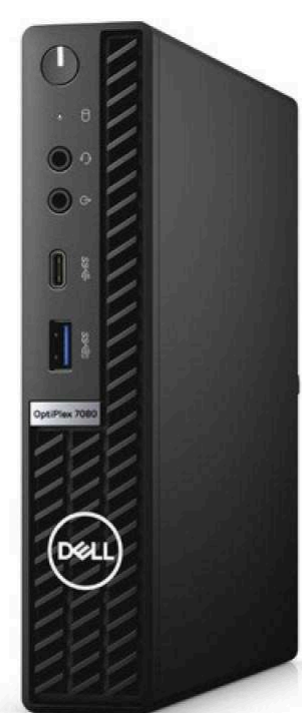
Настольные неттопы Цена по запросу