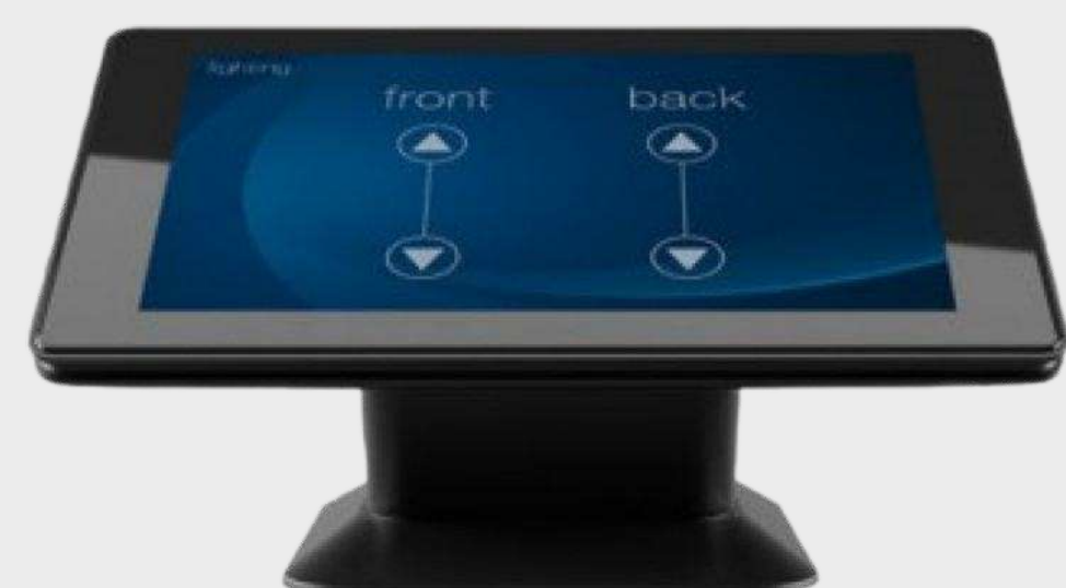
Контроллеры с сенсорным экраном Цена по запросу